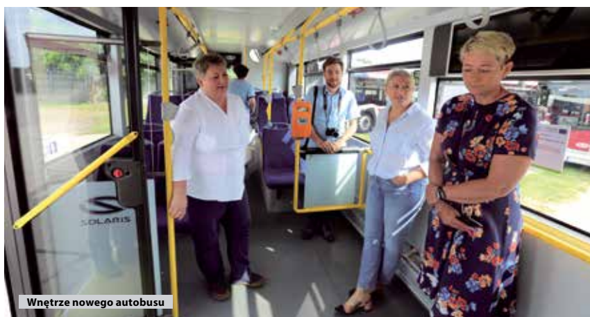
Wnętrze nowego autobusu