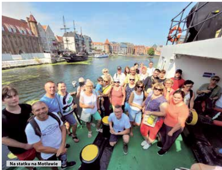
Na statku na Motławie