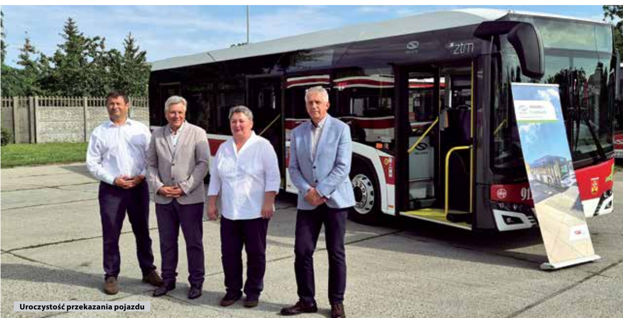
Uroczystość przekazania pojazdu