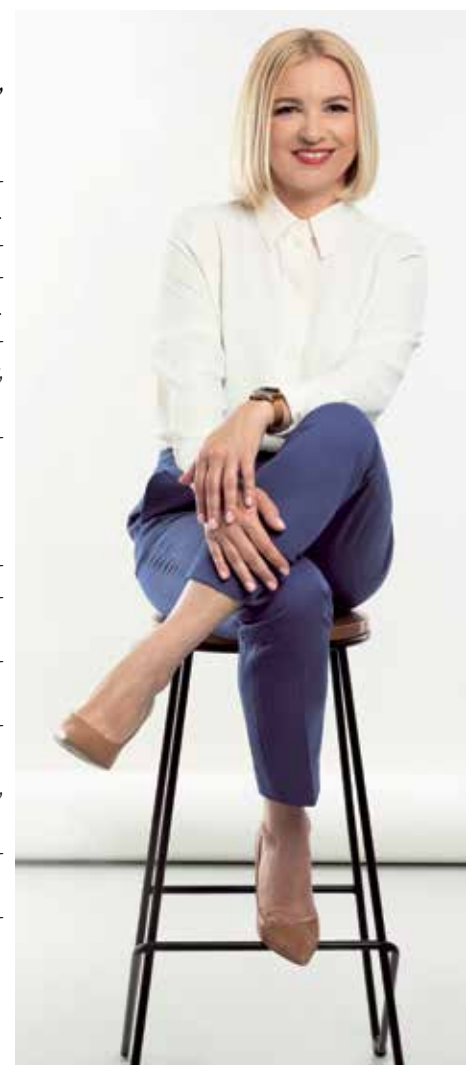
Materiał KKW Koalicja Obywatelska PO.N.IPL.Zieloni