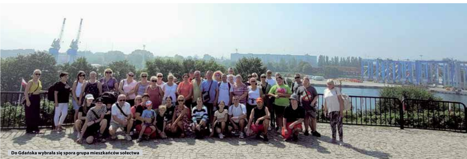
Do Gdańska wybrała się spora grupa mieszkańców sołectwa