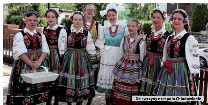
Dziewczyny z zespołu Chłudowianie