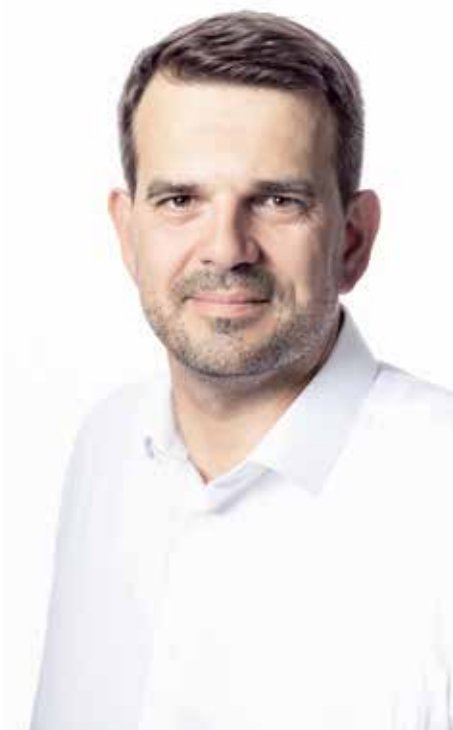
Materiał KWW Trzecia Droga PSL - PL2050 Szymona Holownia

Jako wielki przyjaciel rzemieślników i rolników bardzo wspiera produkcję zdrowej polskiej żywności i postuluje wprowadzenie stawki 0 proc. VAT na żywność wytwarzaną w sposób tradycyjny.